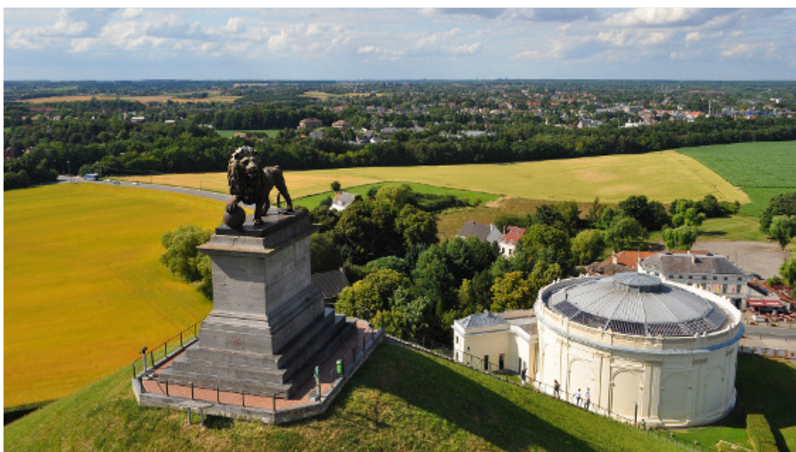
Lion de Waterloo - Panorama - ©MT Waterloo - Jean-Philippe Van Damme

Alors devenez ambassadeur de la marque Wallonia.be !